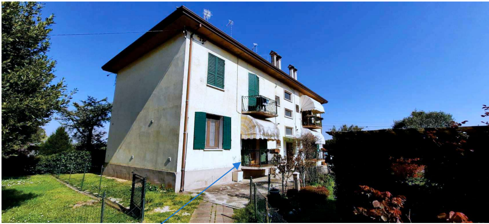
unità 1- piano rialzato

Giudice Delle Esecuzioni: Dott.ssa ELISA TESCO